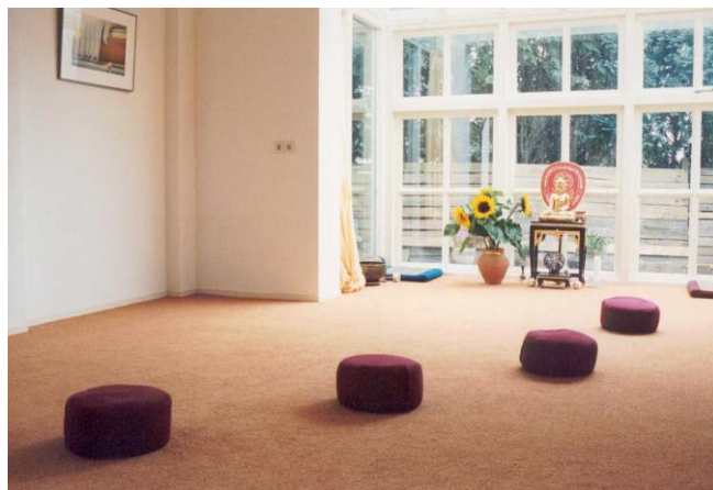
De meditatiezaal van het Retraitecentrum

N.B. Voor zelfstandigen en deelnemers vanuit een bedrijf zijn de verblijfskosten inclusief BTW, terwijl de organisatie- en begeleidingskosten exclusief BTW zijn. In dat geval wordt de factuur naar het opgegeven adres gestuurd.